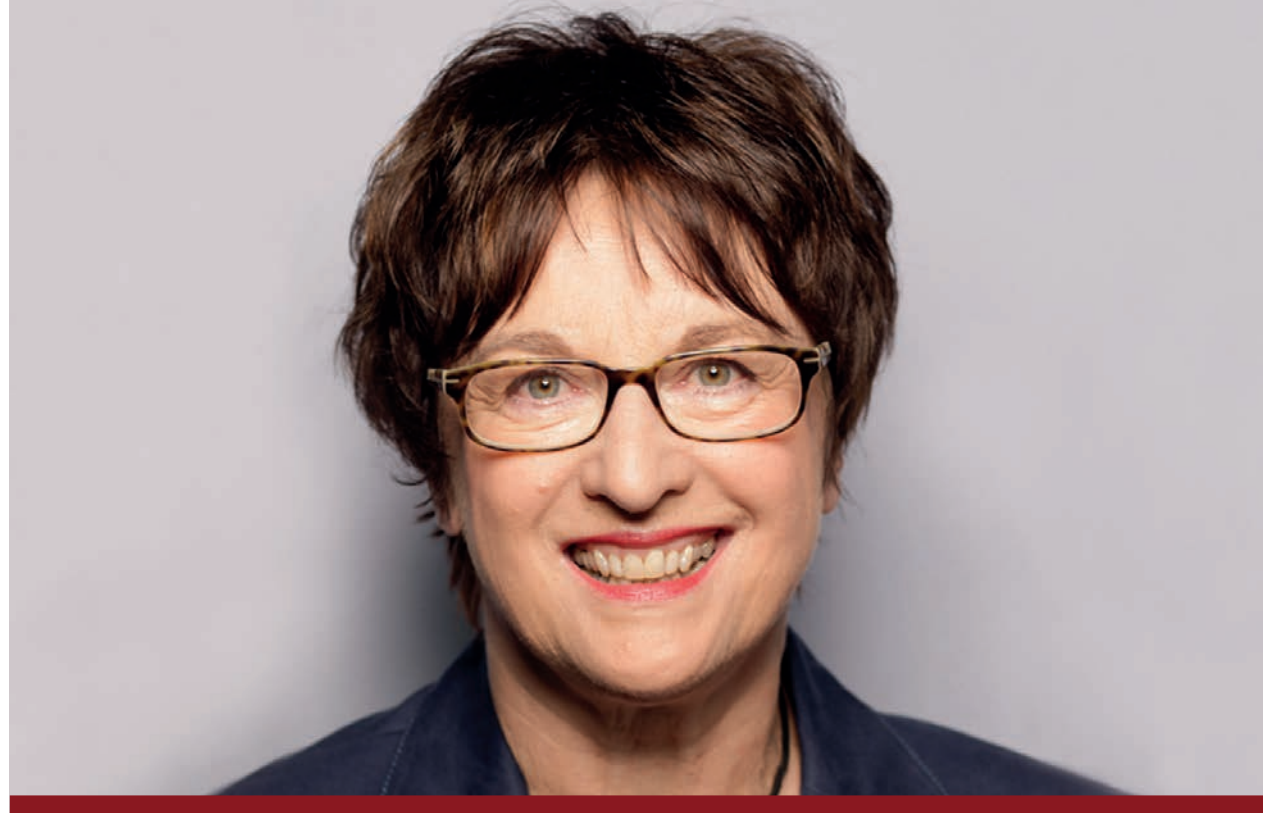
Brigitte Zypries, Bundesministerin für Wirtschaft und Energie

Bundesministerium für Wirtschaft und Energie